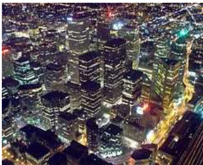
منطقه تجاری مرکز شهر تورنتو در شب

زنان به ویژه در بخش‌های مدیریت خدمات، خدمات آموزشی و تخصصی، خدمات فنی و علمی بسیار فعال هستند و به طور عمده در همین حوزه‌ها به ایجاد کسب‌وکار می‌پردازند. همچنین نیمی از زنان کارآفرین و خوداشتغال کانادایی دارای مدرک دانشگاهی یا دوره‌های آموزشی پس از دیپلم هستند. در حال حاضر زنان با ایجاد کسب‌وکار برای بیش از دو میلیون نفر شغل ایجاد کرده‌اند. با توجه به نقش رو به رشد زنان در اقتصاد کانادا نخست‌وزیر این کشور در سال ۲۰۰۳ فرمان تاسیس گروهی ویژه را برای تسهیل کارآفرینی زنان صادر کرد، وظیفه این گروه شناسایی چالش‌ها و مشکلات پیش‌روی زنان در حوزه کارآفرینی و نیز اشتغال به کار و ارائه راه‌حل برای رفع این مشکلات، برگزاری برنامه‌های آموزشی برای زنان در زمینه‌هایی نظیر تامین اعتبار کارآفرینی است. شرایط اقتصادی کانادا با توجه به اینکه استان‌های این کشور در بسیاری از سیاست‌ها مستقل هستند، هر یک شرایط خاص خود را دارند و نهایتاً وضعیت اقتصادی کانادا برآیندی از مجموع وضعیت اقتصادی تمام استان‌ها خواهد بود. رکودی که با یک حرکت آرام تقریباً از اقتصاد آمریکا شروع شد و اقتصاد جهان را مورد تاثیر قرار داد، همچنان علیرغم تزریق پول‌های فراوان به اقتصاد کشورهای بزرگ اقتصادی و کمک‌های دولتی به اقتصاد این کشورها کاملاً مهار نشده است. ولی اینطور که از اخبار شنیده شد، وضعیت اقتصادی برخی ایالت‌های کانادا چون استان ساسکاچوان و نیوفاندلند و لابرادور نه تنها با بحران جدی روبه‌رو نشد، بلکه در پاره‌ای موارد با رشد نیز مواجه بوده است.