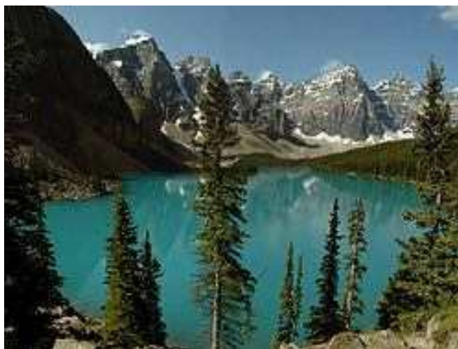
دریاچه مورین در پارک ملی بنف، استان آلبرتا

آب و هوای کانادا روی هم رفته سرد و در بیشتر جاها قطبی است. البته آب و هوا در بخش جنوب غربی، جایی که شهر ونکوور و جزیره ونکوور از استان بریتیش کلمبیا در آن قرار دارند، معتدل است. تورنتو نیز که از شهرهای مهم این کشور است از نظر پویندگی های بوری در جهان بین ۱۰ کشور نخست از نظر بورس است آب و هوای تورنتو سرد و جنگلهای تایگا در این کشور دیده می شود برج سی ان در تورنتو نخستین برج بلند مخابراتی جهان است.